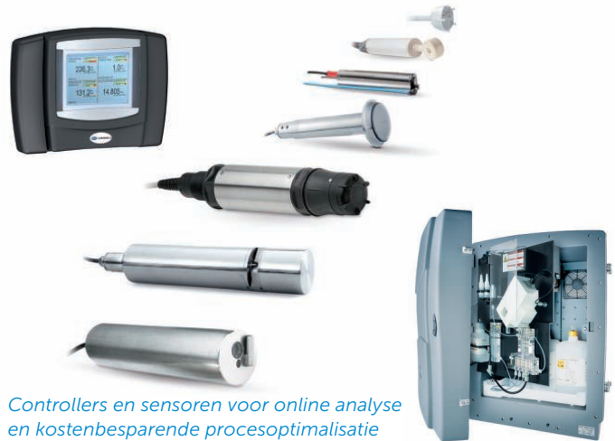
Controllers en sensoren voor online analyse en kostenbesparende procesoptimalisatie