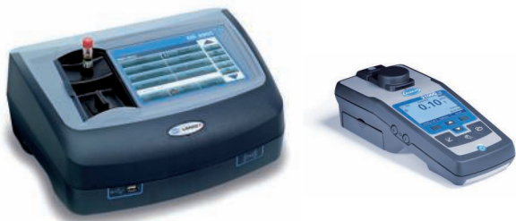
Benchtop- en draagbare instrumenten voor laboratoriumanalyse. Onderhoud, inspectie en Equipment Qualification service beschikbaar voor deze apparatuur.

* Voor aanvullende parameters en oplossingen neemt u contact op met uw plaatselijke HACH LANGE-productspecialist of bezoekt u onze website.